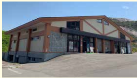
硫黄山レストハウス (食事・お土産販売など)