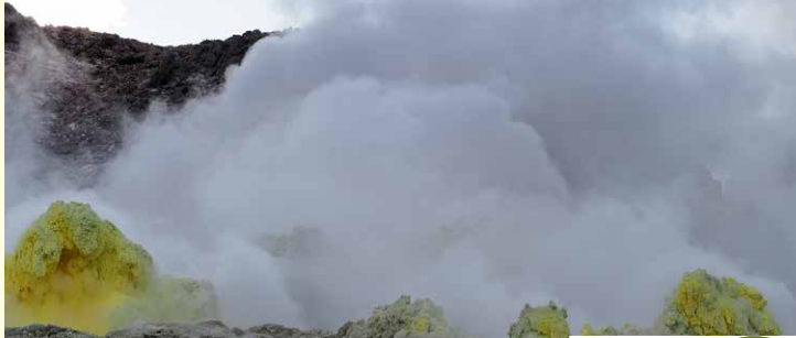
目の前で蒸気をあげる噴気孔

アイヌ語で「アトサヌプリ」、裸の山と呼ばれる硫黄山。山肌からはゴウゴウと音を立てながら噴煙がほとぼしり、周囲には独特の硫黄の匂いが立ち込めています。駐車場すぐにレストハウスがあり、名物温泉たまごや、温玉をつかったスイーツ「硫黄山温玉ソフト」がおすすめです。グリーンシーズンに実施される硫黄山トレッキングガイドツアー（予約制）や火山ガス、酸性土壌などに耐えられる高山性の植物たちが特異な生態系をつくる硫黄山から川湯温泉までの約2.5kmのつじが原探勝路の散策も人気の自然体験です。