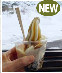
硫黄山名物 温泉卵と温玉ソフト